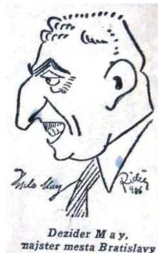
Karikatúra z AZ Magazínu 1936

27.mája 1923 usporiadal Šachový klub Bratislava simultánku s Alexandrom Aljechinom. Aljechin hral proti 25 súperom, 18 partii vyhral, 4 remizoval a 3 prehral. Jedným z hráčov,